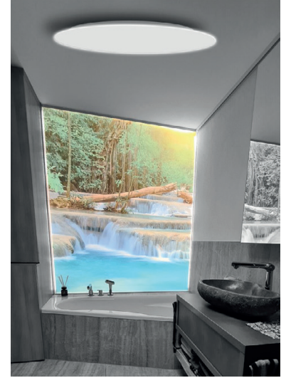
Verschiedene Ausführungen der Infrarot Heizlicht-Paneele und Lichtbild.