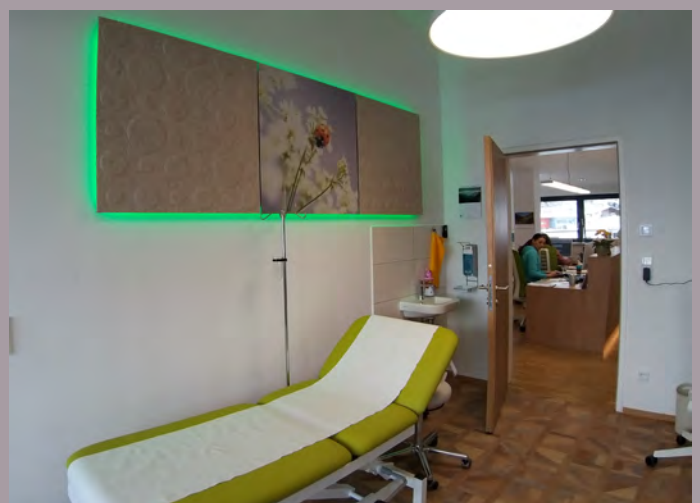
Praxis Dr. Greinwald, Breitenwang