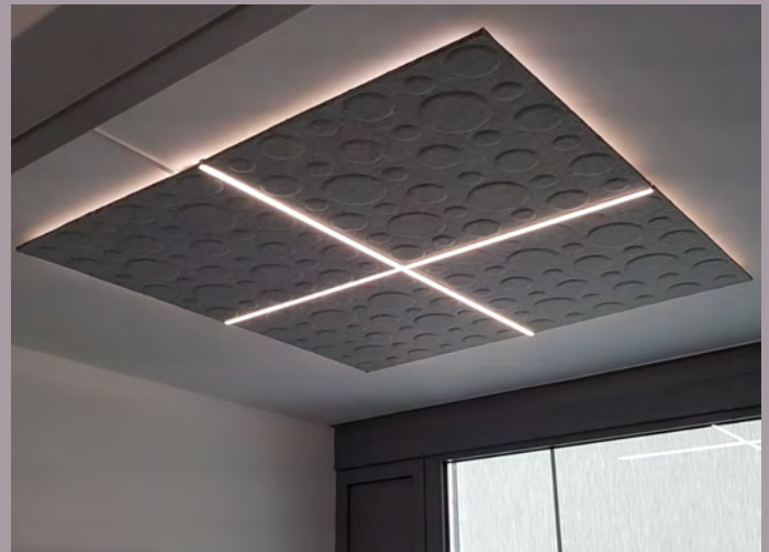
Steuerberater Macheiner, Innsbruck

Eine 100% nachhaltige und innovative Lösung für viele Anwendungsbereiche. Erleben Sie wohlthuende Ruhe, Wärme und Licht vereint.